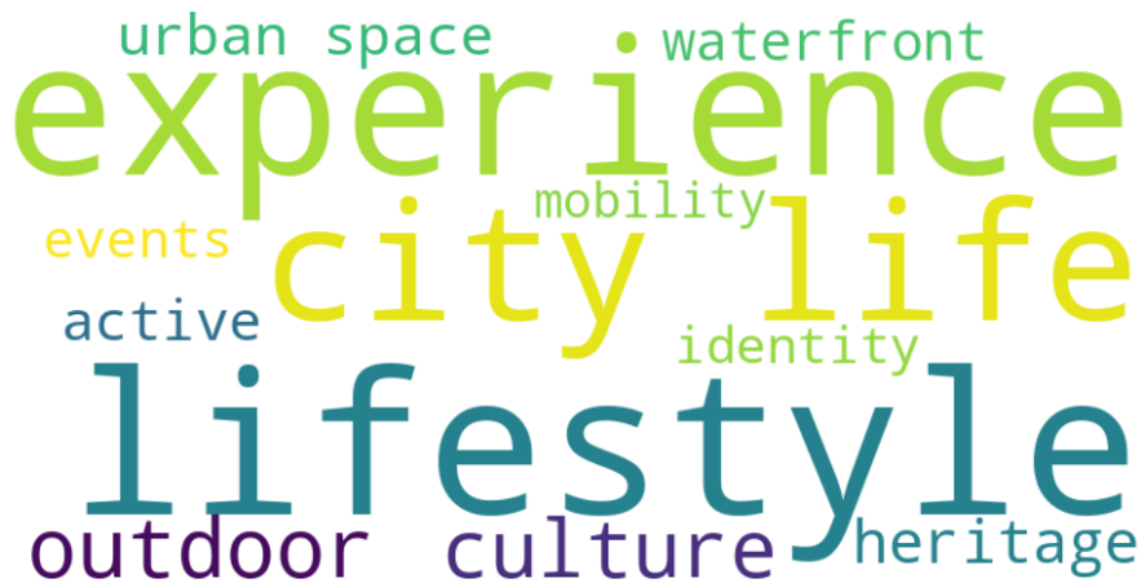
Ryc. 4. Chmura pojęć odnoszących się do sportu i rekreacji w filmach promocyjnych miast europejskich

sportowej i rekreacyjnej z narracją kulturową oraz tożsamościową miasta. Sport i rekreacja funkcjonują w tych narracjach jako element całościowego doświadczenia destynacji, a nie wyłącznie jako komponent infrastrukturalny.