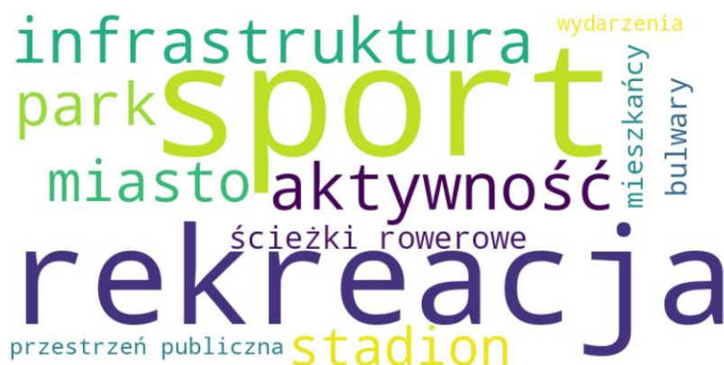
Ryc. 3. Chmura pojęć odnoszących się do sportu i rekreacji w filmach promocyjnych miast polskich

W chmurze pojęć dotyczącej miast polskich dominują terminy związane z infrastrukturą i dostępnością przestrzeni rekreacyjnych, takie jak sport , rekreacja , infrastruktura , stadion , park , ścieżki rowerowe czy bulwary . Wskazuje to na sposób konstruowania narracji, w której sport pełni przede wszystkim funkcję elementu funkcjonalnego i użytkowego, silnie powiązanego z przestrzenią publiczną oraz codziennymi praktykami mieszkańców. Pojęcia odnoszące się do stylu życia i doświadczenia miejskiego pojawiają się rzadziej i mają charakter drugoplanowy.