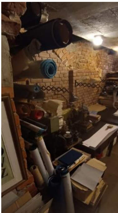
Ryc. 1. Pracownia introligatorska w Domu Słów w Lublinie