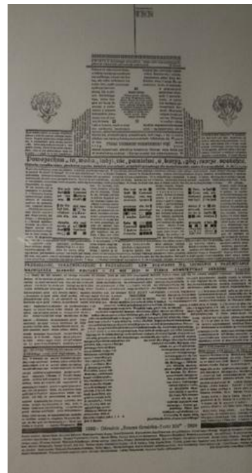
Ryc. 3. Skład afisza z okazji 30-lecia Ośrodka „Brama Grodzka-Teatr NN”, Dom Słów w Lublinie

Turystyka literacka może przybierać różne formy w zależności od tego kto ją uprawia oraz jakie motywacje kierują turystą. Termin „turysta literacki” użyto po raz pierwszy w latach 90 XX wieku, kiedy badania nad turystyką literacką jako elementem turystyki kulturowej dopiero się rozpoczynały. Już w XIX wieku funkcjonował termin „pielgrzym literacki”. Trafnie oddawał on charakter ówczesnych podróży, które często miały wymiar duchowy i wiązały się z odwiedzaniem miejsc życia oraz twórczości wybitnych literatów. Część z tych zachowań i motywacji nadal ma miejsce, a turyści literaccy próbują zaspokoić swoje potrzeby duchowe przez swego rodzaju „zbliżenie się” do autora lub jego dzieła [Watson 2022, s. 93].