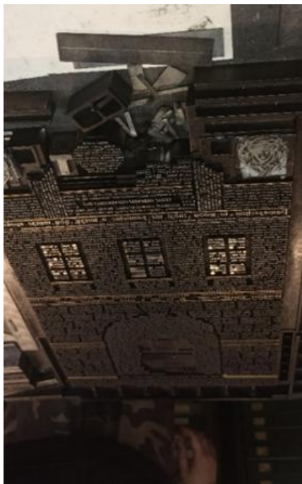
Ryc. 2 Układ czcionek z okazji 30- lecia Ośrodka „Brama Grodzka- Teatr NN” w prasie drukarskiej, Dom Słów w Lublinie